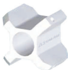
Guía RPT 075