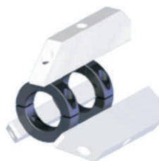
Guía RPT 070