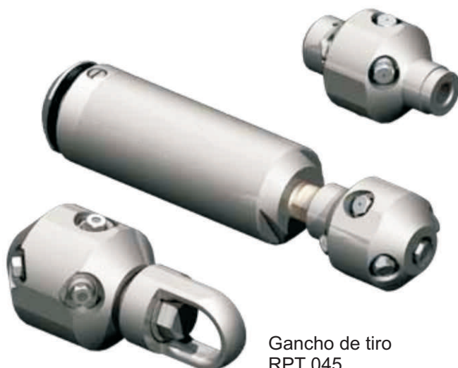
Porta toberas RPT 044-P4-6 Toberas de 1/8"