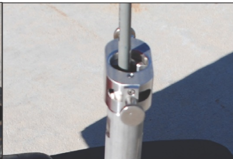
Pinza tope del latiguillo