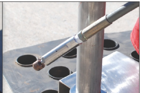
Para usar con las toberas rotativas