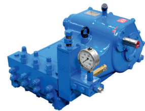
3200A01 Con válvula reguladora A02

A02 - B02: Cuerpo culata de acero inoxidable. Colector aspiración de fundición. AI - BI: Cuerpo culata y colector aspiración en acero inoxidable.