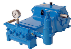
3200B Con válvula reguladora C