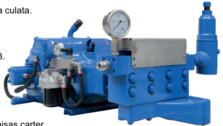
ROSTOR 3200 A02 Con válvula reguladora C